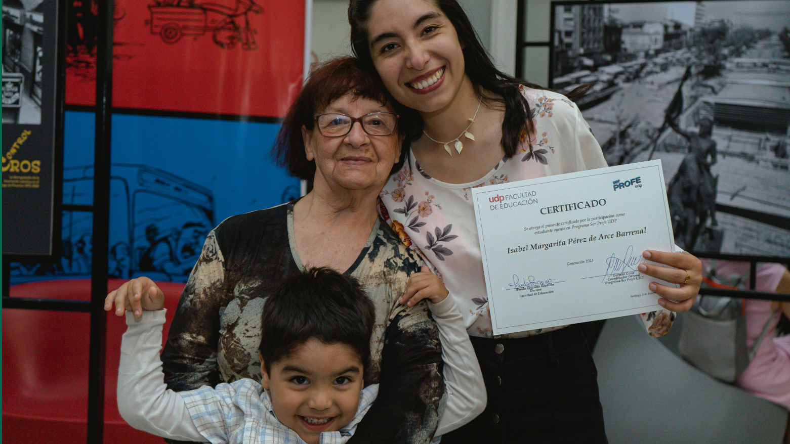
Estudiante junto con su familia en la ceremonia de egreso del PATP 2023.

tación éste representó un 6% de la matrícula total, pasando a 11% en la cohorte 2024. Se estima que para el 2025 15% de los estudiantes de primer año de pedagogía sean oriundos del programa Ser Profe UDP.