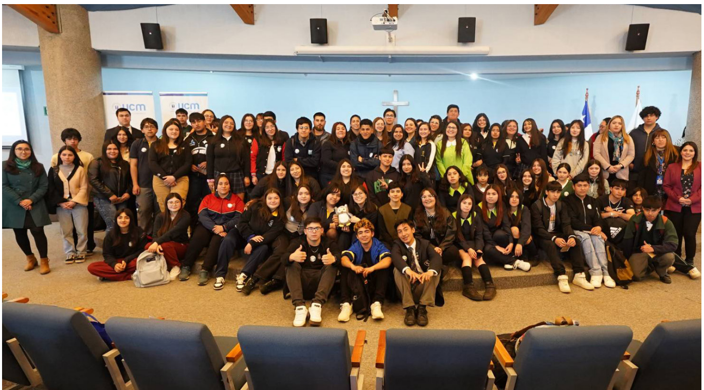
Charla vocacional Quiero Ser Profe - Elige Educar en PATP Universidad Católica del Maule, 2024.

Tras diseñar el plan de trabajo y formar un pequeño equipo, surgió Elige Educar. Institución que implementa un plan de acompañamiento vocacional con el objetivo de detectar, informar, orientar y motivar a estudiantes de educación media de alto desempeño académico, con interés en estudiar una carrera de educación, para confirmaran sus intereses y finalmente eligieran esta profesión.