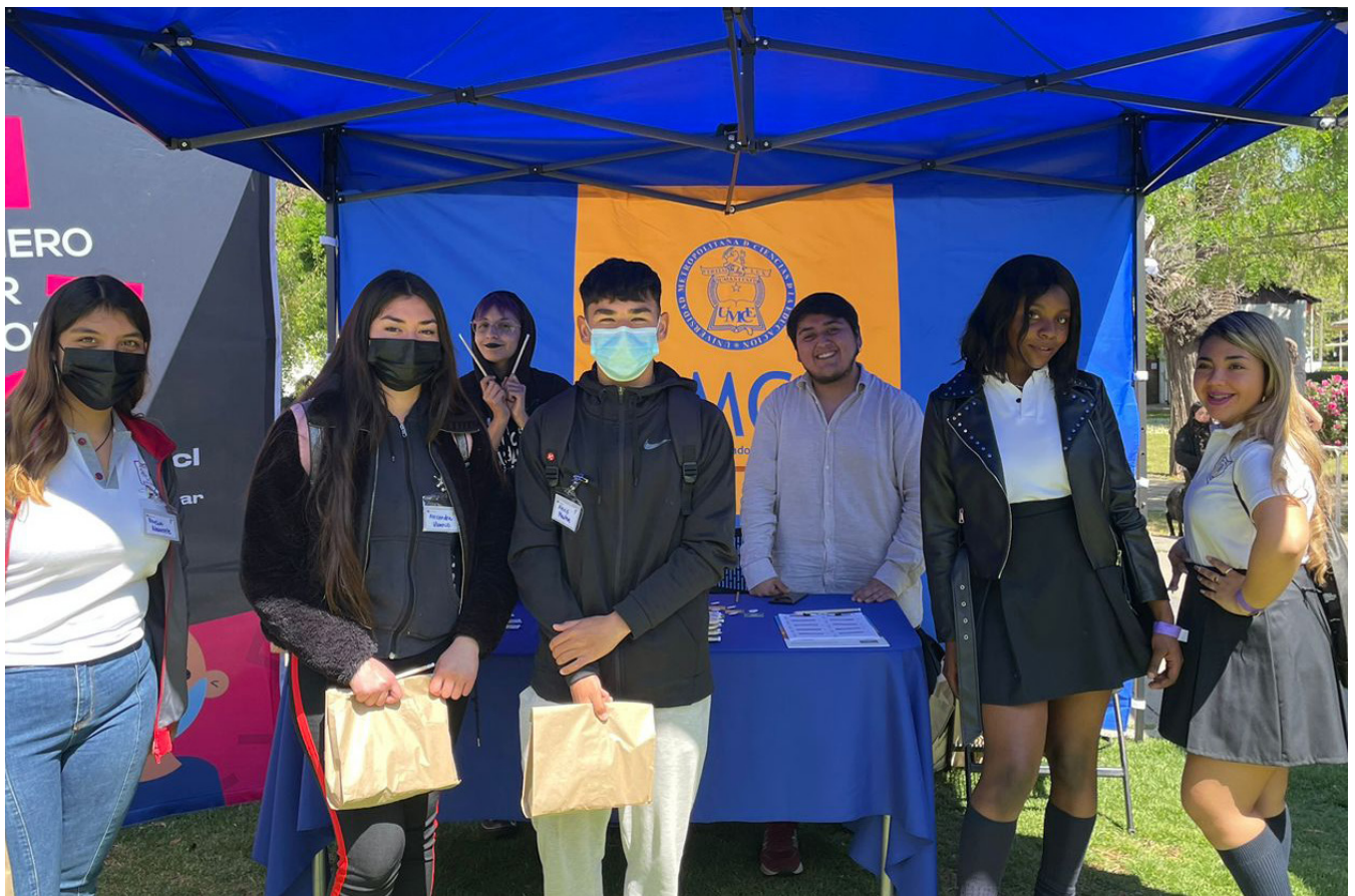
Tutores del programa Quiero Ser Profe - Elige Educar en Feria UMCE, 2022.

Otro elemento que potencia y contribuye a la mejora continua de los procesos de los programas es la evaluación de cada acción por parte de los usuarios y