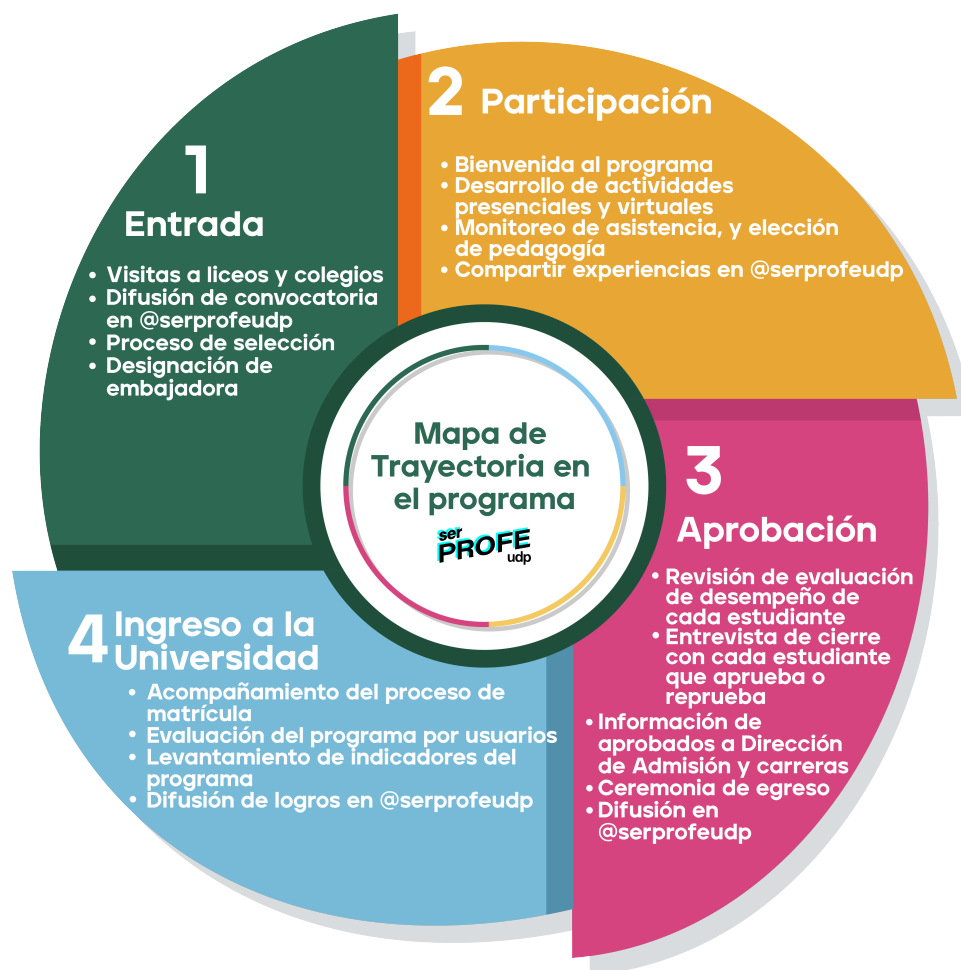
Figura 4: Mapa de trayectoria Ser Profe UDP

El tercer pilar del programa se refiere al acompañamiento a la trayectoria de los participantes. Por un lado, las embajadoras del programa, que están a cargo del módulo de inserción universitaria, guían y apoyan los y las participantes del programa. Estas embajadoras son seleccionadas por las direcciones de cada carrera por su motivación por la pedagogía y compromiso con la Facultad, así como su capacidad de liderazgo entre sus pares. Asimismo, pasan por un riguroso proceso de capacitación para actuar en el programa.