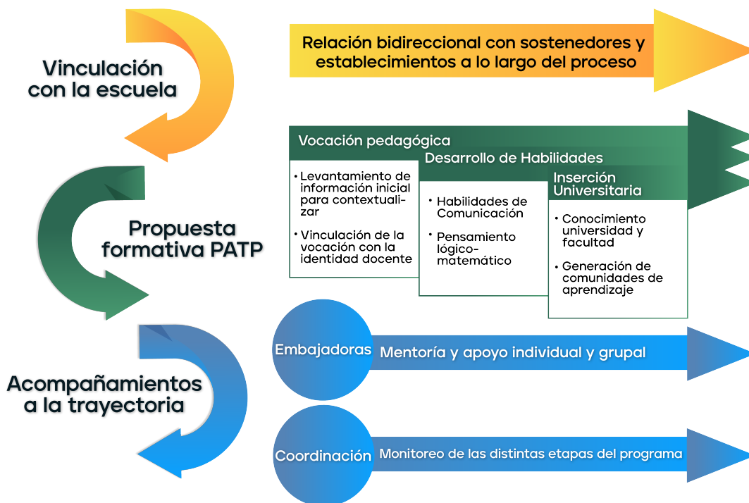
Figura 3: Modelo del programa Ser Profe UDP

La vinculación con el sistema escolar , por medio de alianzas estratégicas con sostenedores y establecimientos educativos, es el primer pilar del programa. Este esfuerzo conjunto de atracción de estudiantes de enseñanza media hacia las pedagogía se materializa en diversas acciones: firmas de convenios; visitas a liceos y colegios, reuniones de coordinación con orientadores y encargados de continuidad de estudios; talleres que permita a los estudiantes descubrir su vocación y experimentar una forma distinta de enseñar y aprender y difusión de actividades en la universidad. Una vez en el programa, la escuela participa de manera activa en el acompañamiento del proceso formativo de sus estudiantes por medio de reuniones periódicas y eventos con padres, madres y apoderados. Asimismo, las escuelas son actores claves en la mejora continua del programa entregando su retroalimentación.