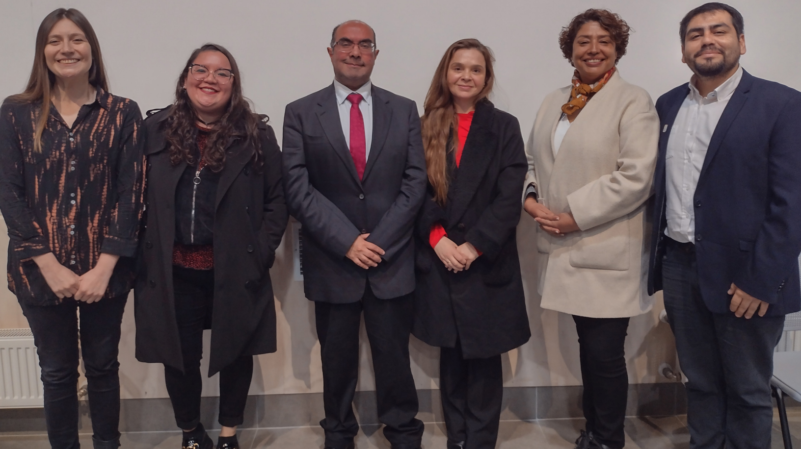
Dirección y Coordinación de los programas Quiero Ser Profe - Elige Educar y Escuela de Talentos Pedagógicos UCT, 2023.

“El aporte del programa Quiero Ser Profe junto a los profesionales encargados de Elige Educar ha sido muy enriquecedor para los estudiantes de la Escuela de Talentos Pedagógicos UCT. Desde la instancia de participar de talleres de habilidades, así como también de las conferencias que han presentado en nuestros seminarios, dando a conocer la importancia de la vocación y la formación inicial en los futuros docentes.”