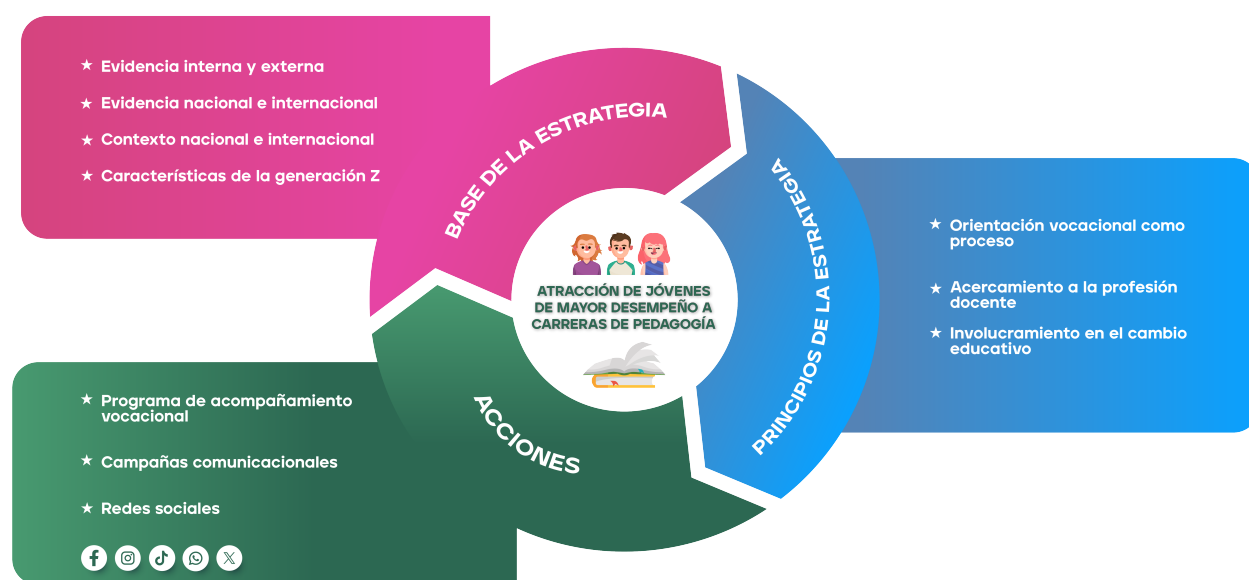
Figura 1 “Modelo del programa Quiero Ser Profe”

La información: El programa responde a la necesidad de superar la falta de conocimiento en torno al acceso a las pedagogías. Se hace un esfuerzo por presentar la información de manera clara y sencilla, asegurando precisión y detalle en cada respuesta proporcionada. Se enfatiza en la importancia de proporcionar recursos informativos accesibles, detallados y precisos que apoyen a las personas en la toma de decisiones asociadas a su futuro educativo.