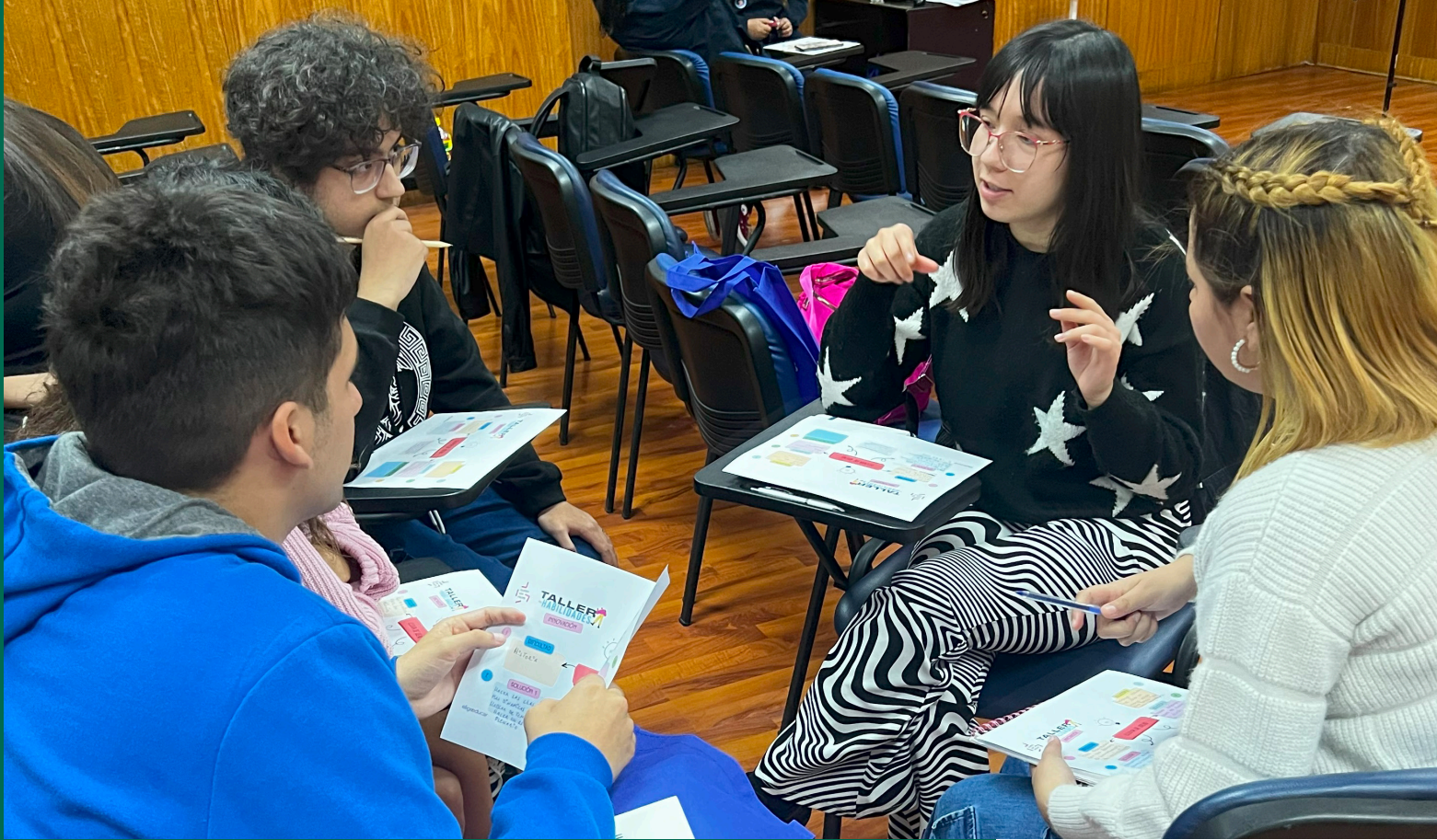
Taller de Habilidades Quiero Ser Profe - Elige Educar en PATP Universidad Católica Silva Henríquez, 2024.