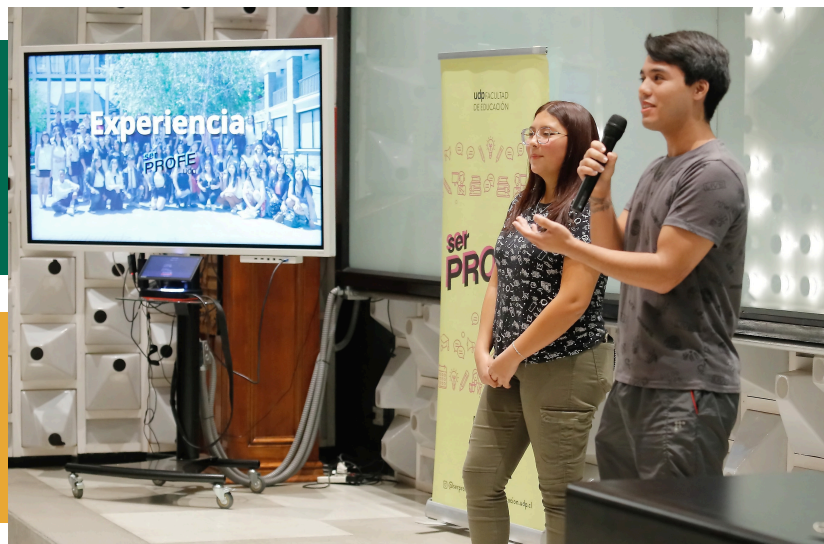
Jornada Generaciones Ser Profe UDP.

En este mapa, cobra especial relevancia los canales de difusión y comunicación que posee el programa, como Instagram, Tik Tok y WhatsApp. Por estos medios se resuelven de manera rápida y directa dudas y consultas, y se visibilizan las diversas acciones del programa. Es clave destacar el protagonismo de las embajadoras y estudiantes en las acciones de difusión y comunicación del programa, lo que ha permitido aumentar el alcance y relevancia, pero también como una herramienta para construir un sentido de identidad y comunidad.