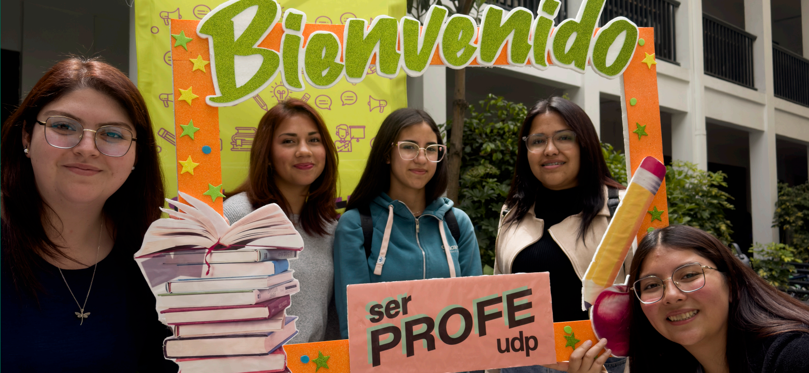
Evento clases abiertas junto a estudiantes PATP y Embajadoras Ser Profe UDP.

“Lo más importante que aprendí fue que pueden existir múltiples respuestas a una interrogante, por ejemplo hablamos de los límites y libertades de las personas y hubieron distintos pensamientos sobre la libertad que nunca me había puesto a pensar.”