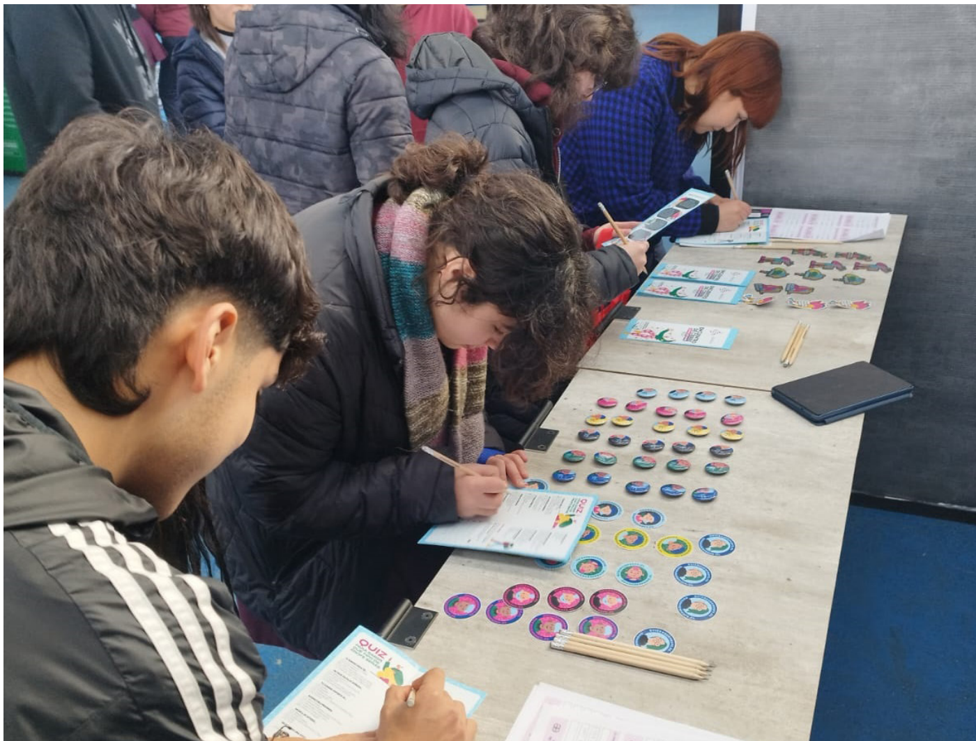
Estudiantes en Feria Vocacional inscribiéndose en el stand Programa Quiero Ser Profe - Elige Educar, 2024.

más de trabajar en el posicionamiento de la carrera de pedagogía. De esta forma, se tiene como objetivo crear y fortalecer una comunidad digital, destacar los ejes temáticos de cada programa y los hitos del proceso de acceso a la educación superior; así como difundir e invitar a la participación en las diversas acciones del programa Quiero Ser Profe.