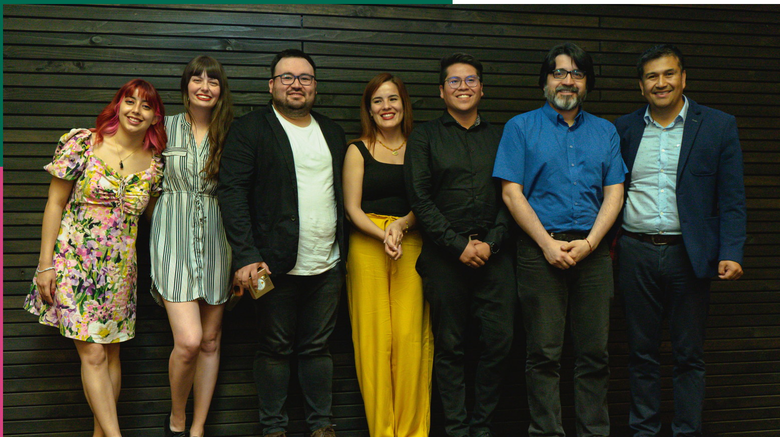
Equipo Docente y de Coordinación PATP Ser Profe UDP.

Simultáneamente, la inversión económica es esencial para proporcionar las herramientas, recursos y apoyo necesarios para que los PATP sean efectivos. Esto puede incluir becas, ayudas económicas, infraestructura adecuada, y el desarrollo de programas de formación complementaria. Una asignación adecuada de recursos financieros permite que los PATP ofrezcan un apoyo sólido y continuo, y que puedan