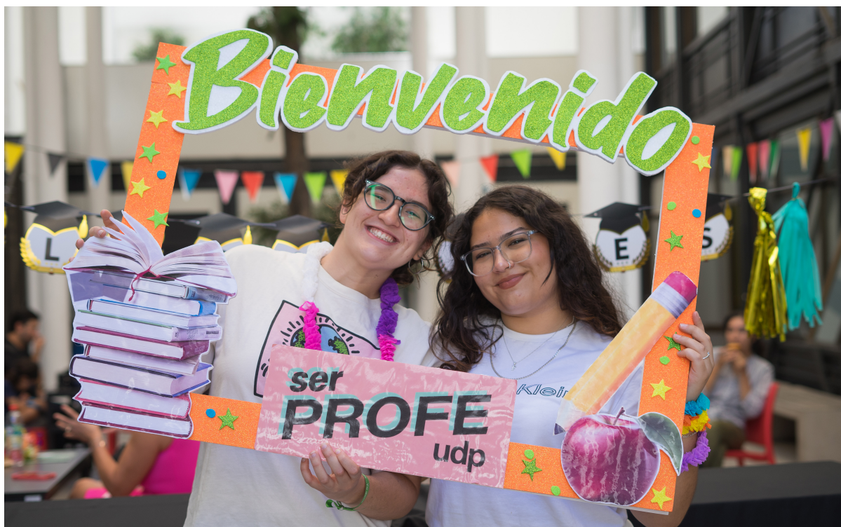
Bienvenida de Generación PATP 2023 Ser Profe UDP.

Esta diversidad destaca la necesidad de una evaluación y monitoreo continuos para alinear los PATP con las necesidades cambiantes del sistema educativo. Además, se requiere fomentar una mayor colaboración y estandarización entre las instituciones para maximizar el impacto de estos programas y garantizar que todos los estudiantes tengan oportunidades formativas equitativas. Así, el fortalecimiento de los PATP contribuye no solo a la formación de docentes de calidad, sino también al desarrollo integral del sistema educativo.