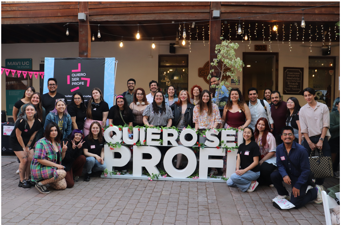
Hito de Cierre del programa Quiero Ser Profe - Elige Educar en Museo de Artes Visuales (MAVI), 2023.

Luego de cada tutoría efectiva, en la cual la o el tutor tiene un diálogo con una o un estudiante, se envía una encuesta de satisfacción. Este instrumento incluye un apartado para comentarios, que año tras año se ha convertido en un espacio de valoración del acompañamiento recibido. En la sistematización de los comentarios del año 2023, se observa que las personas acompañadas destacan el método de tutoría, el cual se centra en la orientación y en brindar información sobre las carreras de pedagogía. También afirman que el programa busca crear un espacio seguro, basado en valores clave, para apoyar a las futuras generaciones en su camino hacia la pedagogía.