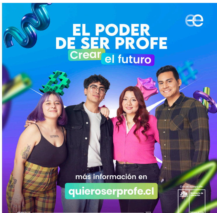
Campaña de atracción a las pedagogías Quiero Ser Profe - Elige Educar, 2023.

Espacio movilizante: Cada tutoría busca generar reflexiones en las personas acompañadas. No se pretende ser un espacio de respuestas genéricas sobre lo vocacional, sino que a través de un diálogo personalizado y comprensivo, junto con la entrega de información, se espera que cada persona pueda movilizarse e ir construyendo una decisión que sea autónoma, consciente e informada sobre la pedagogía.