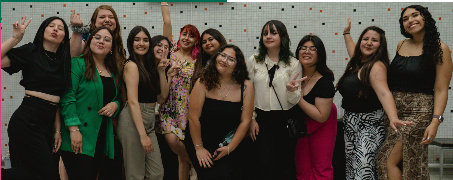
Equipo embajadoras en ceremonia de egreso PATP 2023 Ser Profe UDP.

“Me da alegría motivar a las nuevas generaciones en el estudio de la pedagogía. Es un proceso en el que se ve cómo se despierta el interés y la pasión por enseñar. Además, la experiencia es enriquecedora, ya que contribuye a formar futuros profesionales que tendrán un impacto positivo en la educación.” Embajadora, Estudiante de Educación Básica UDP