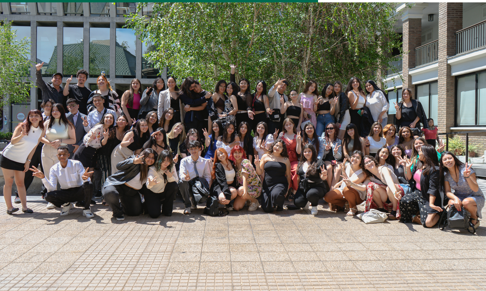
Ceremonia de egreso Generación 2023 junto a equipo de embajadoras Ser Profe UDP.

Dentro del componente de formación del programa Ser Profe UDP, se destaca que la evaluación de sus participantes es eminentemente formativa. Esto significa que está centrada en el proceso y no utiliza calificaciones numéricas, en su lugar se observa el desarrollo y evolución de cada estudiante por los diferentes actores que monitorean el programa. Esta ca-